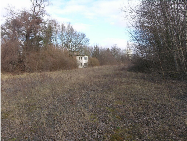
Verschiebebahnhof der Fabrik Deuben - Gleiskörper des Verschiebebahnhöfes (ab 1936)