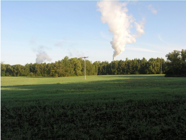
Bruchfeld der Grube Naumburg - Blick über das Bruchfeld in Richtung Nord, das Kraftwerk Deuben in Betrieb