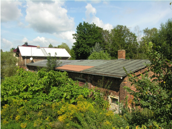
Werkstatt der Grube Hedwig - das Werkstattgebäude der Grube Hedwig heute