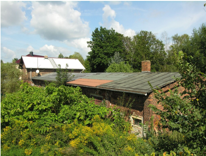
Werkstatt der Grube Hedwig - das Werkstattgebäude der Grube Hedwig heute