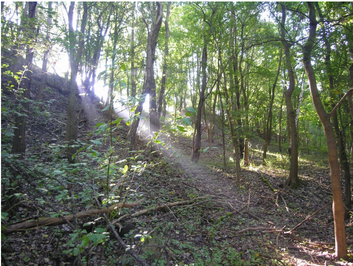
Außenkippe des Tagebau Pirkau - Böschung entlang des Bahndammes

Schlagwörter: Abraumhalde Fachsicht(en): Denkmalpflege Gemeinde(n): Teuchern, Zeitz Kreis(e): Burgenlandkreis Bundesland: Sachsen-Anhalt