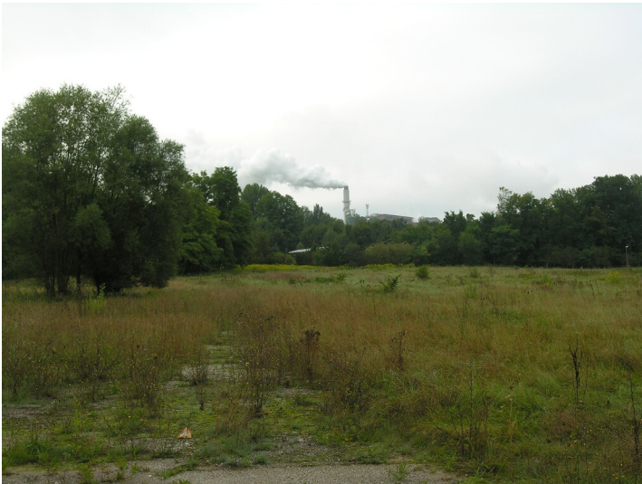
Klärteich der Schwelerei Emilie - Situation des ehemaligen Klärteiches; Blick SW