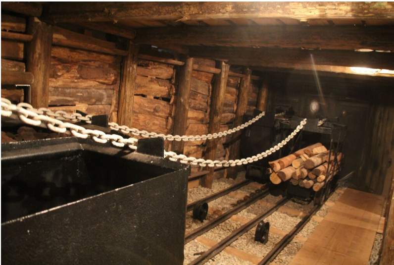
Bergbaumuseum Deuben - Untertageförderstrecke Nachbildung