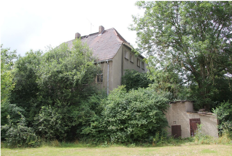
Rittergut Tackau - Ansicht des ehemaligen Ritterguts Tackau