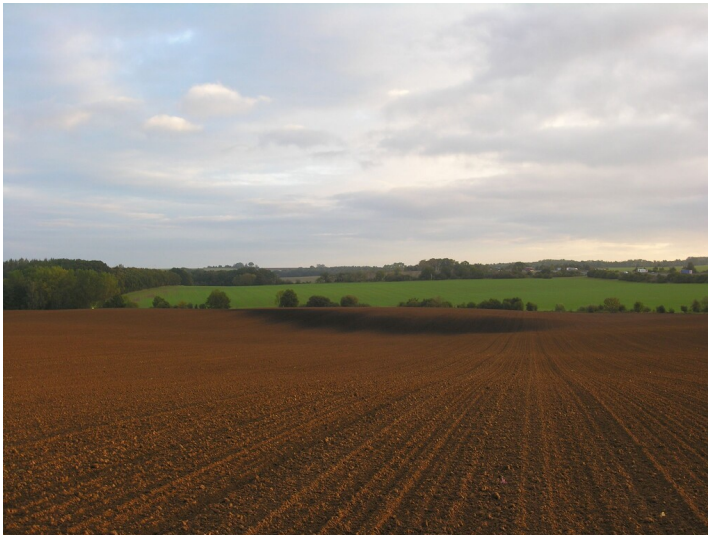
Abfallhalde einer Schwelerei - das ehemalige Fabrikgelände mit Abfallhalde macht sich durch dunkle Bodenverfärbung bemerkbar; Blick N