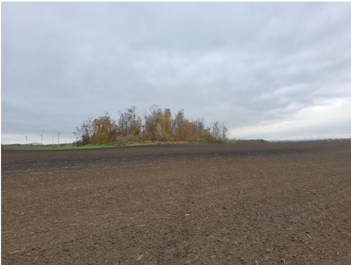
Schacht, Tagesanlagen und Fabrik der Grube Antonie - Situation an der ehemaligen Grube Antonie