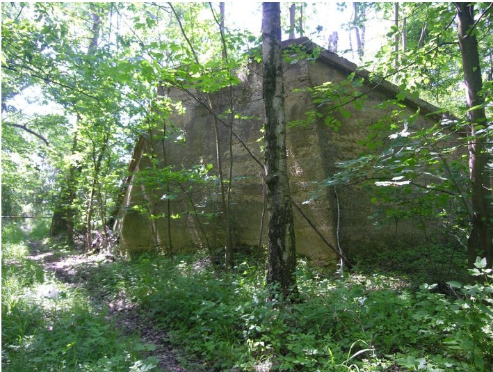
Damm der Walpernhainer Kohlebahn (1913-1931) - Damm und Rampe der Kohlebahn