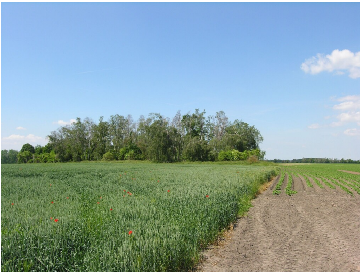
Aschehalde der Fabrik Antonie - Ansicht der Halde von Osten, das ehemalige Fabrikgelände rechts davon