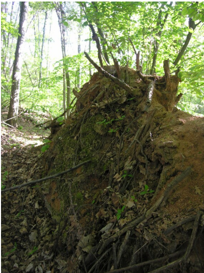
Aschehalde der Schwelerei Grube 394 Waldau - Baumwurf mit Ascheaufschluss