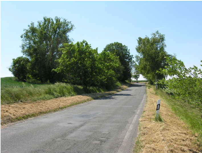
Schacht und Tagesanlagen der Grube Nr. 383 - Schacht und Tagesanlagen in dem bewaldeten Hügel links der Straße; Blick Süd