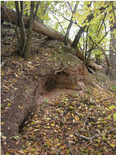
Aschehalde der Fabrik Roda - Aufschluss an der nördlichen Böschung der Aschehalde