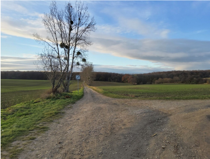
Kohlenstraße zur Saline Kösen - Kohlenstraße biegt nach rechts (Norden) ab