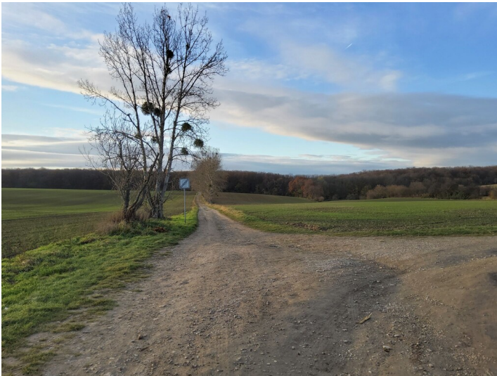
Kohlenstraße zur Saline Kösen - Kohlenstraße biegt nach rechts (Norden) ab