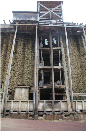
Gradierwerk der Saline Kösen - Gesamtansicht