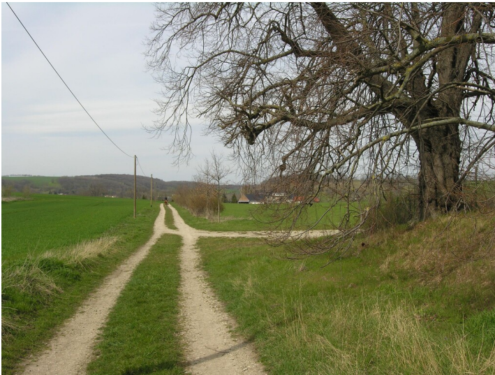
Schächte der Königlichen Grube - Situation vormaliger Grube, links vom Weg; Blick NW Fotograf/Urheber: NAME FEHLT