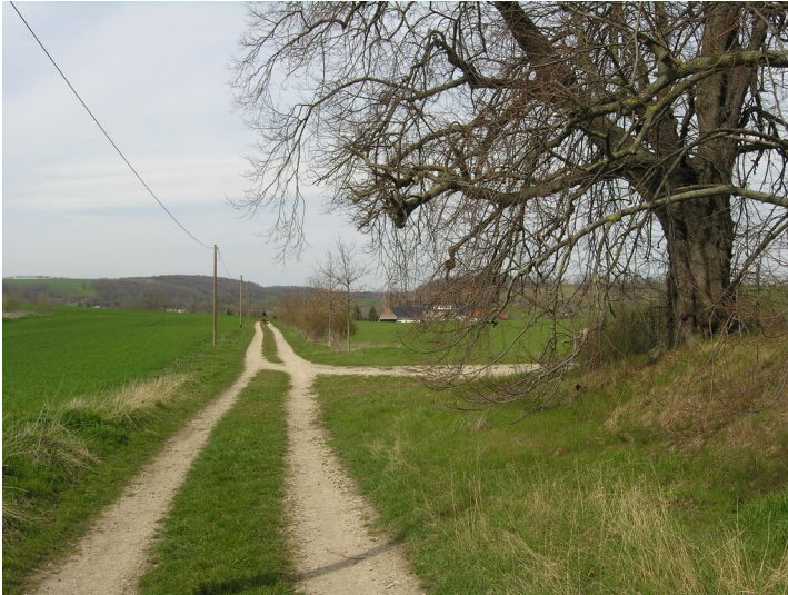
Schächte der Königlichen Grube - Situation vormaliger Grube, links vom Weg; Blick NW