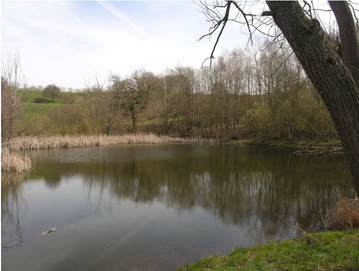
Bruchfeld der Grube 274 - Senkungserscheinung mit Teich