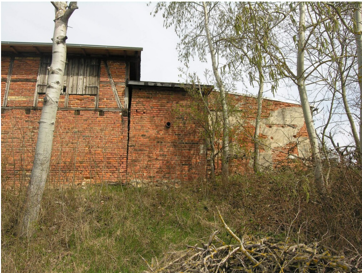
Revierhaus der Grube 274 - Wirtschaftsgebäude