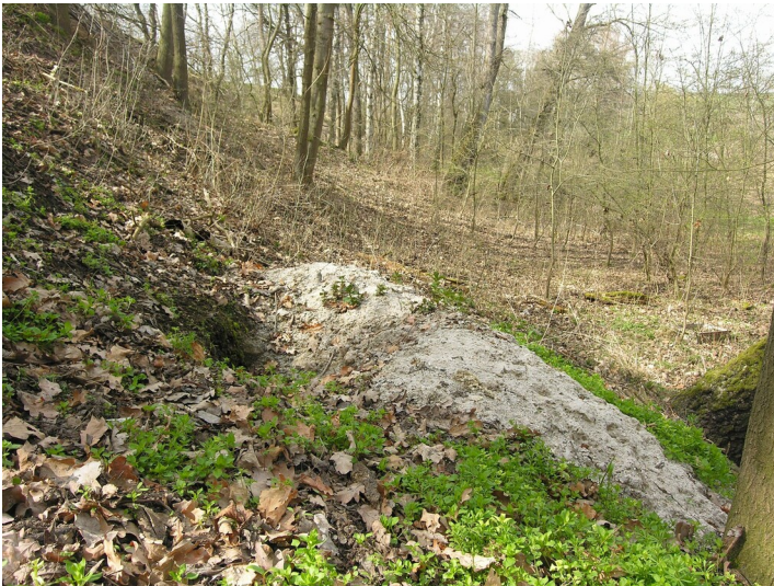
Schächte der Gruben 117 und 163 - Tagebaukante mit geologischen Aufschlüssen