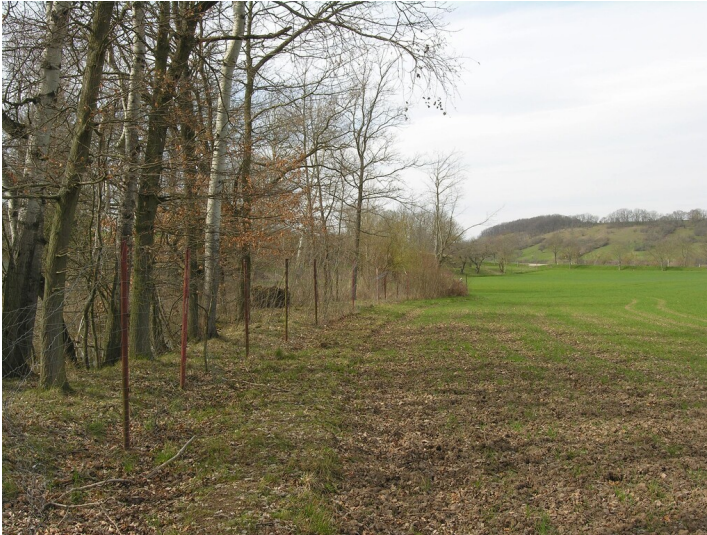
Schacht und Tagesanlagen der Grube 119 - ehemaliges Grubengelände, Blick NW