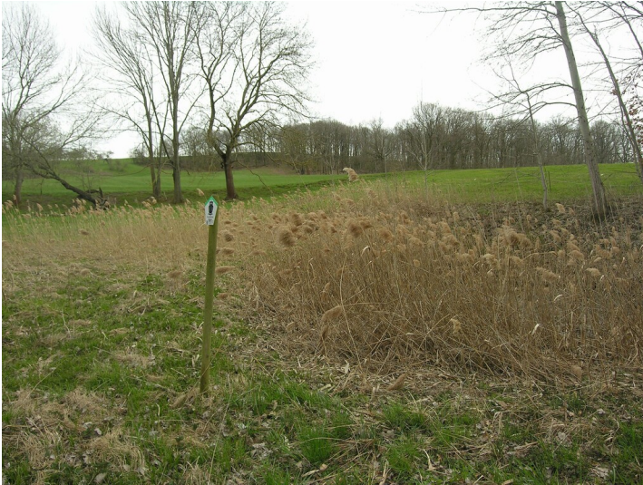
Bruchfeld der Gruben 234 und 282 - das Bruchfeld der Grube 234; die schilfbestandene Senke im Vordergrund war möglicherweise ein Schacht; Blick SE