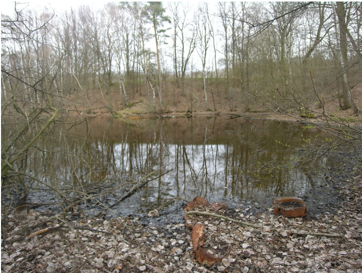
Tagebau der Grube 287 - Tagebaurestloch mit Teich; Blick E