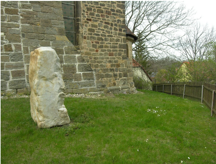
Menhir aus Braunkohlequarzit - Menhir an der Kirche Görschen