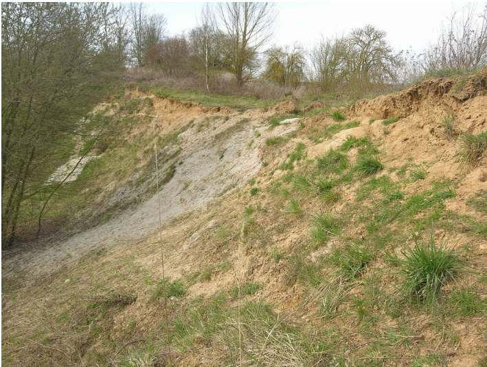
Geländespuren mit Verdacht auf alten Bergbau - erodierte Tagebaukante, später als Sandgrube erweitert; Blick N