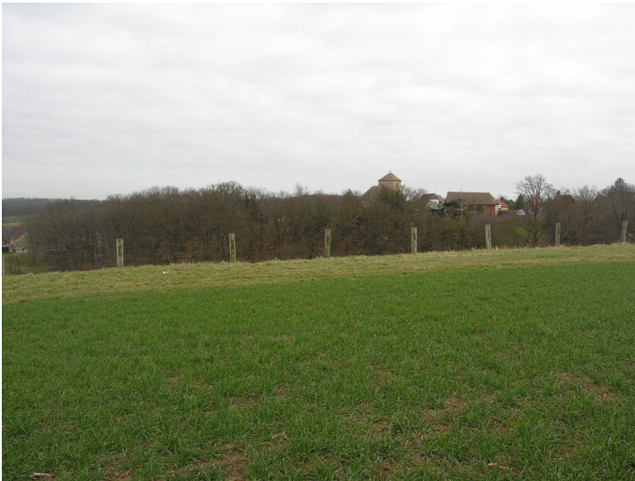
Schacht der Grube 129 - Situation in Bereich des ehemaligen Schachtes; Blick NE nach Görschen Fotograf/Urheber: NAME FEHLT