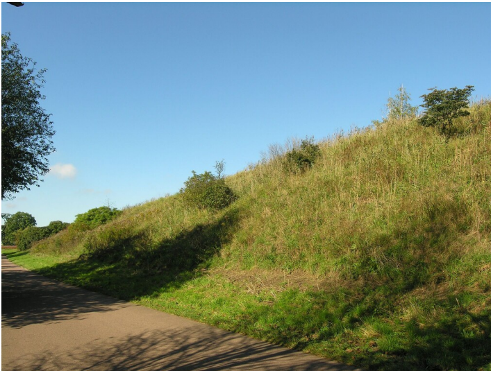
Aschehalde der Schwelerei Grube 387 - an der südlichen Böschung der Aschehalde; neben dem Weg nach Neu-Gerstewitz