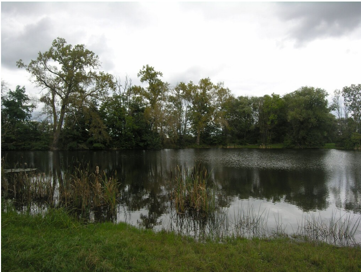
Tagebau der Grube 436 - See im Tagebaurestloch; Blick NE

Schlagwörter: Tagebau Fachsicht(en): Denkmalpflege Gemeinde(n): Lützen Kreis(e): Burgenlandkreis Bundesland: Sachsen-Anhalt