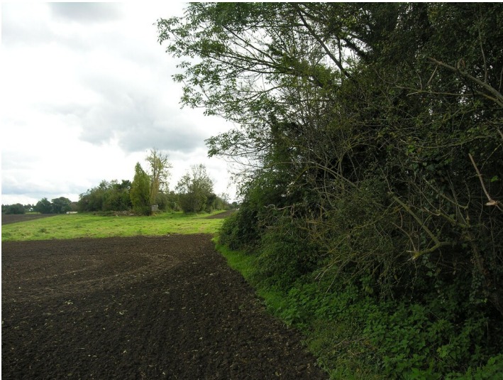
Kippe des Tagebau Grube 436 - an den Kippen; Blick S

Schlagwörter: Abraumhalde Fachsicht(en): Denkmalpflege Gemeinde(n): Lützen Kreis(e): Burgenlandkreis Bundesland: Sachsen-Anhalt