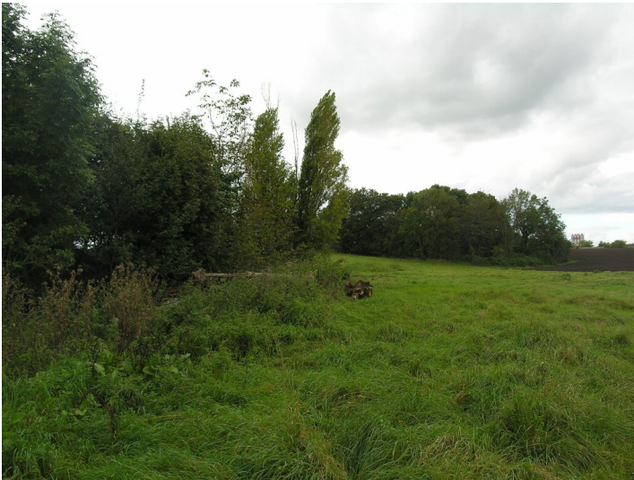
Kippe des Tagebau Grube 436 - an den Kippen; Blick Nord

Schlagwörter: Abraumhalde Fachsicht(en): Denkmalpflege Gemeinde(n): Lützen Kreis(e): Burgenlandkreis Bundesland: Sachsen-Anhalt