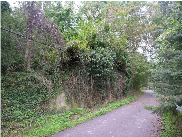
Eisenbahndamm über die Thierbach-Aue - Stützmauer einer Brücke, an der Aschehalde; Blick W