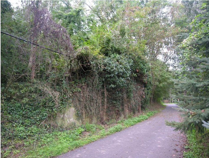
Eisenbahndamm über die Thierbach-Aue - Stützmauer einer Brücke, an der Aschehalde; Blick W