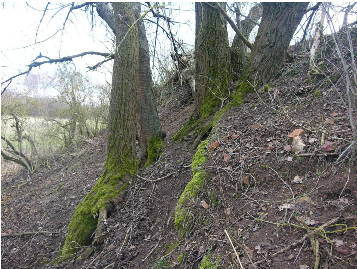
Abfallhalde der Fabrik Neue Sorge - Böschung an der Aschehalde