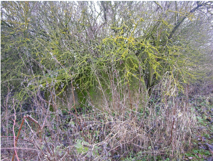
Schacht, Tagesanlagen und Fabrik der Grube Neue Sorge I - Fundament des Förderturmes