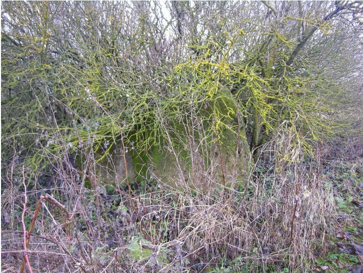
Schacht, Tagesanlagen und Fabrik der Grube Neue Sorge I - Fundament des Förderturmes