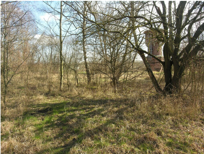
Schacht, Tagesanlagen und Fabrik Grube Neue Sorge - das Fabrikgelände heute, mit Wasserturm