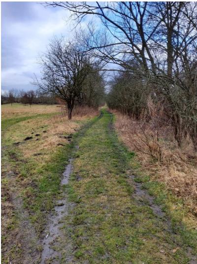
Kohlenweg von der Grube Neue Sorge zur Zuckerfabrik - Blick nach Norden, alter Weg