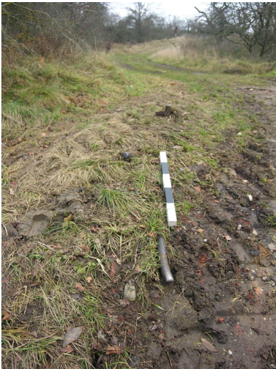
Seilbahn von Grube Hermann Schaede zur Fabrik Groitzschen - Rest eines Fundamentes mit Eisenbolzen; Maßstab 0,5 m