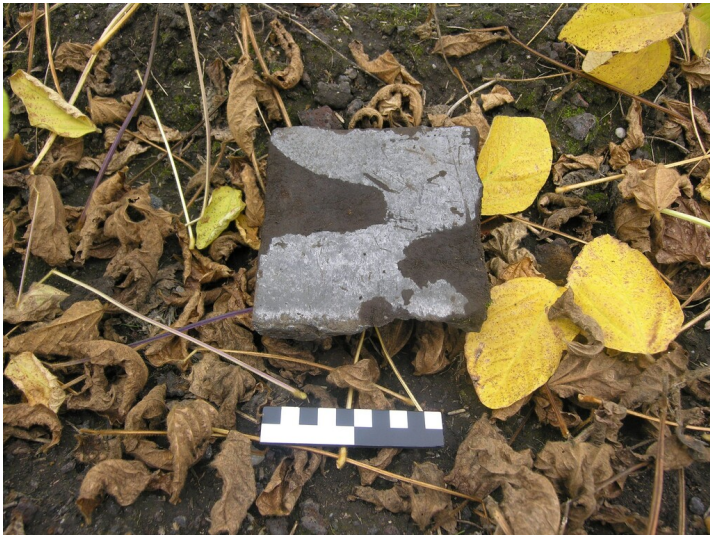
Schacht, Tagesanlagen und Fabrik der Grube Karl Oskar - Oberflächenfund im Fabrikgelände, Schamottestein, glasierte Innenseite ; Maßstab: dl-by-de/2,0 cm