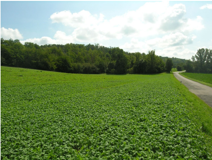
Schächte mit Handförderung - Beim Fuchgrund, Situation ehemaliger Schächte mit Handförderung (um 1850); Blick S