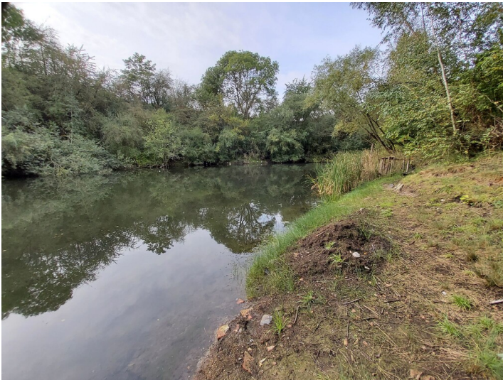
Tagebau der Grube Batzack - Tagebaurestloch mit Wasser gefüllt Fotograf/Urheber: NAME FEHLT

Schlagwörter: Tagebau Fachsicht(en): Denkmalpflege Gemeinde(n): Hohenmölsen Kreis(e): Burgenlandkreis Bundesland: Sachsen-Anhalt