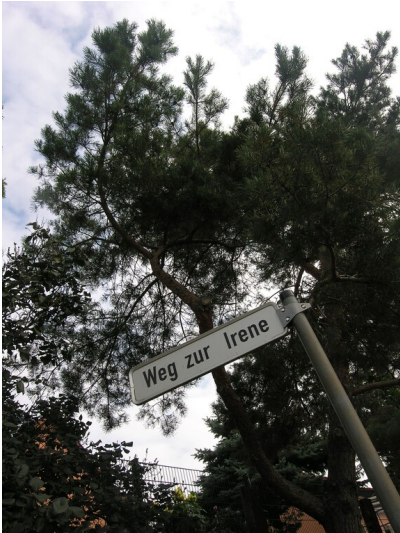
Straßenname Weg zur Irene - Weg zur Irene, Straßenschild in Keutchen