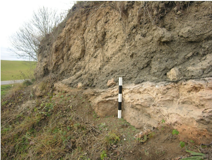
Aschehalde der Schwelerei von Gruben 502 und Friedrich Franz - Aschehalde der Schwelerei von Gruben 502 und Friedrich Franz