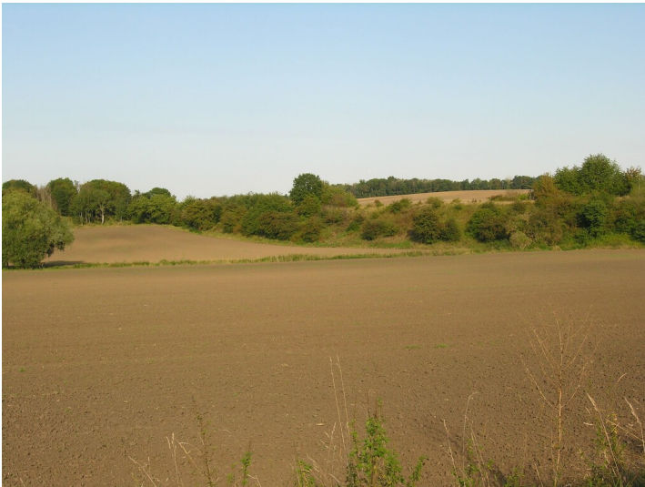
Eisenbahnstrecke Großkorbetha-Deuben - stark erhöhter Damm; Blick SE