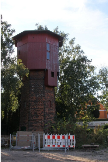
Wasserturm Oberwerschen - Gesamtansicht