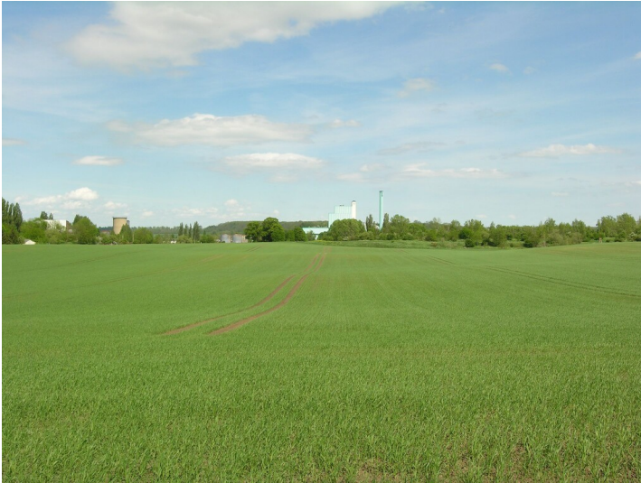
Bruchfeld der Grube 247 - das Bruchfeld; Blick E, zur Fabrik Köpsen und Kraftwerk Wühlitz