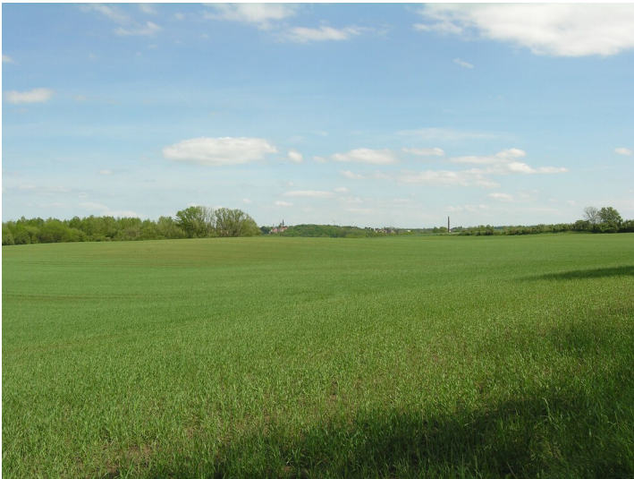
Schacht, Tagesanlagen und Fabrik der Grube 247 - das ehemalige Fabrikgelände; Blick SE