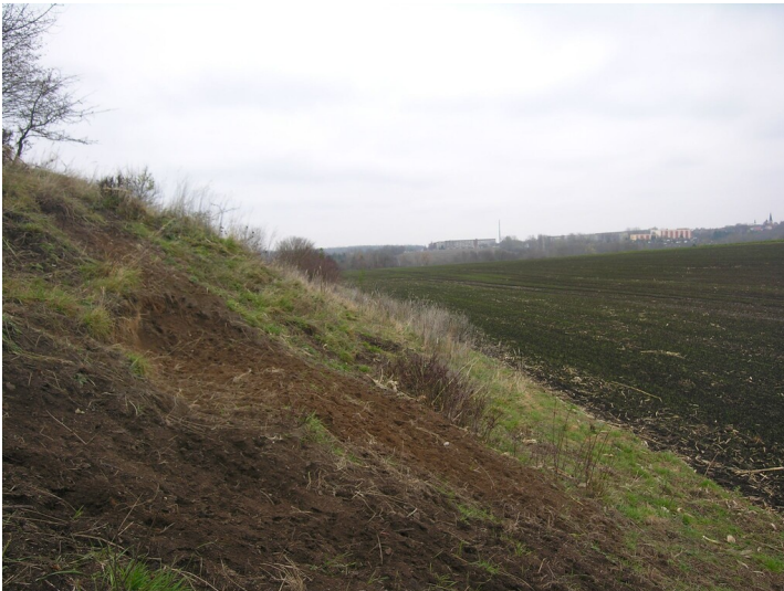
Aschehalde der Schwelerei Grube 458 - an der südlichen Böschung; Aufschlüsse mit Asche und Kokspartikeln; Blick Richtung Hohenmölsen