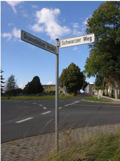
Straße Schwarzer Weg - Straßenschild "Schwarzer Weg", an der Kreuzung bei der Fabrik Webau; Blick N