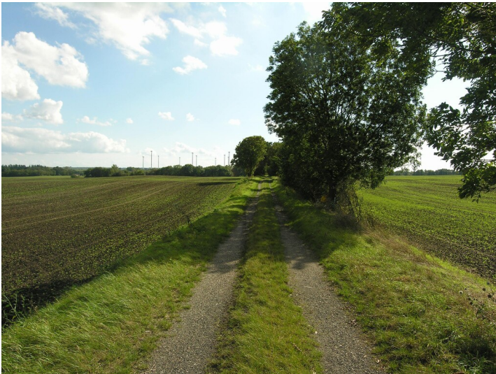
Straße zu den Gruben 498 und 371 - der Weg in südliche Richtung, nach Rössuln