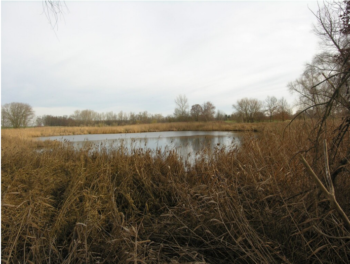
Bruchfeld der Grube 498 - Absenkung über Bruchfeld mit Standgewässer "Der Haase"