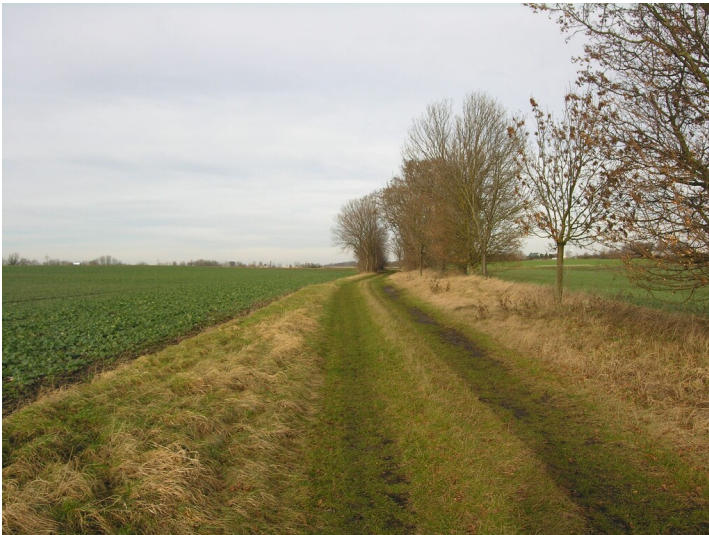
Schacht, Tagesanlagen und Fabrik der Grube 371 - die ehemalige Fabrik auf dem Feld links des Weges; Blick Nord